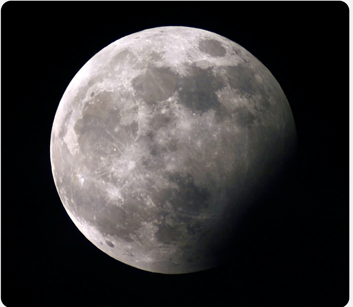
Mondfinsternis vom 31.12.2009. Ähnlich wie bei der Finsternis am 25. April 2013 handelt es sich hier um eine partielle Mondfinsternis von geringer Größe: Bei der Finsternis im Jahr 2009 wurden rund 3% der Mondscheibe durch den Kernschatten der Erde verfinstert.

Um 21:54 MESZ tritt der Mond in den Kernschatten der Erde ein. Bereits um 22:07 Uhr wird die größte Verfinsternung erreicht, wobei nur 0,3% der Mondscheibe vom dunklen Kernschatten der Erde verfinstert werden. Der Mond wird zu diesem Zeitpunkt knapp 16^\circ über den südöstlichen Horizont stehen. Um 22:21 MESZ endet die Verfinsternung durch den Kernschatten schon wieder, die Verfinsternung des Mondes durch den Halbschatten der Erde wird bis etwa 23:09 MESZ erkennbar bleiben.